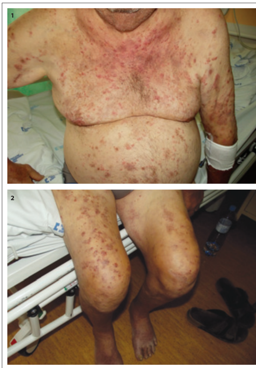
Obr. 1 a 2. Kožní změny při VEXAS syndromu, dermatologická diagnóza byla neutrofilní dermatitida, Sweetův syndrom.

Periferní krev byla odeslána na molekulárně biologické vyšetření do Ústavu