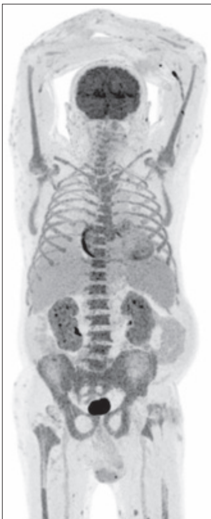
Obr. 4. Ložiska s jasně patologickou akumulací FDG nebyla nalezena, ale abnormním nálezem je relativně vyšší akumulace FDG v kostní dřeni celého zachyceného skeletu (výpadky v místech TEP kyčlí), ( SUV_{max} do 6,38 v sakrální kosti). Normalizovala se akumulace FDG v horním laloku l. plíce po předchozí alveolitidě. Difúzně hraniční až mírně vyšší akumulace FDG ve slezině ( SUV_{max} 3,82) – v 1/2023 byla pod úroveň akumulace jaterní. Povrchově v kůži a podkoží HKK a DKK více drobných fokálních akumulací FDG ( SUV_{max} do 5,28 dorzálně v polovině levého stehna), méně i v kůži/podkoží hrudníku, břicha, boků, hýždí, a dalších místech.

Abnormalitou je rovněž aktivita ve stěně pravé síně srdeční (mimo standardní metabolicky aktivní stěnu LK srdeční). Další rozložení FDG v rozsahu snímání hlavy, trupu i končetin bez abnormalit. Nejsou známky metabolicky aktivních chrupavek (nos, uši, trachea) – jen jedna drobná fokální akumulace na levém ušním boltci ( SUV_{max} 5,7) – v kůži?