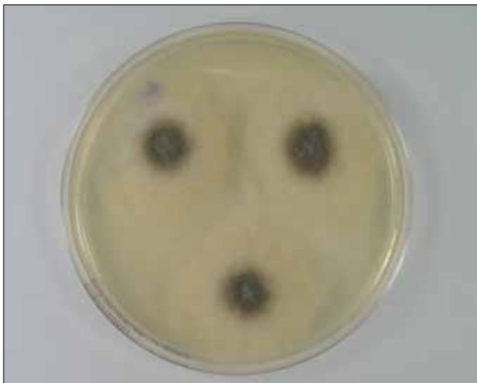
Obr. 1. Kultura Mucor sp. na Sabouraudově agaru.