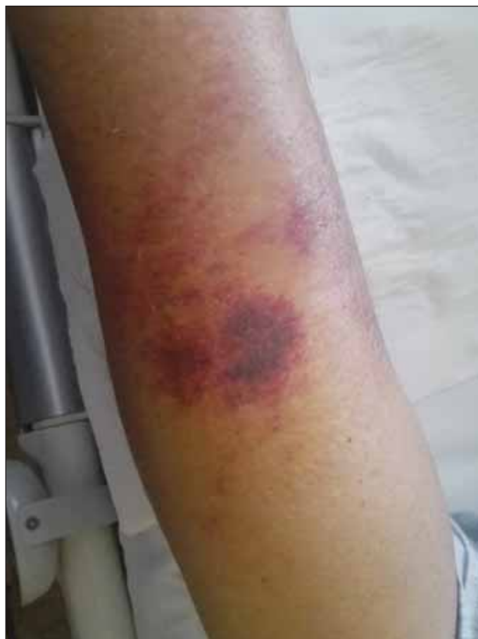
Obr. 4. Kožní forma mukormykózy – dorzální strana předloktí levé horní končetiny.