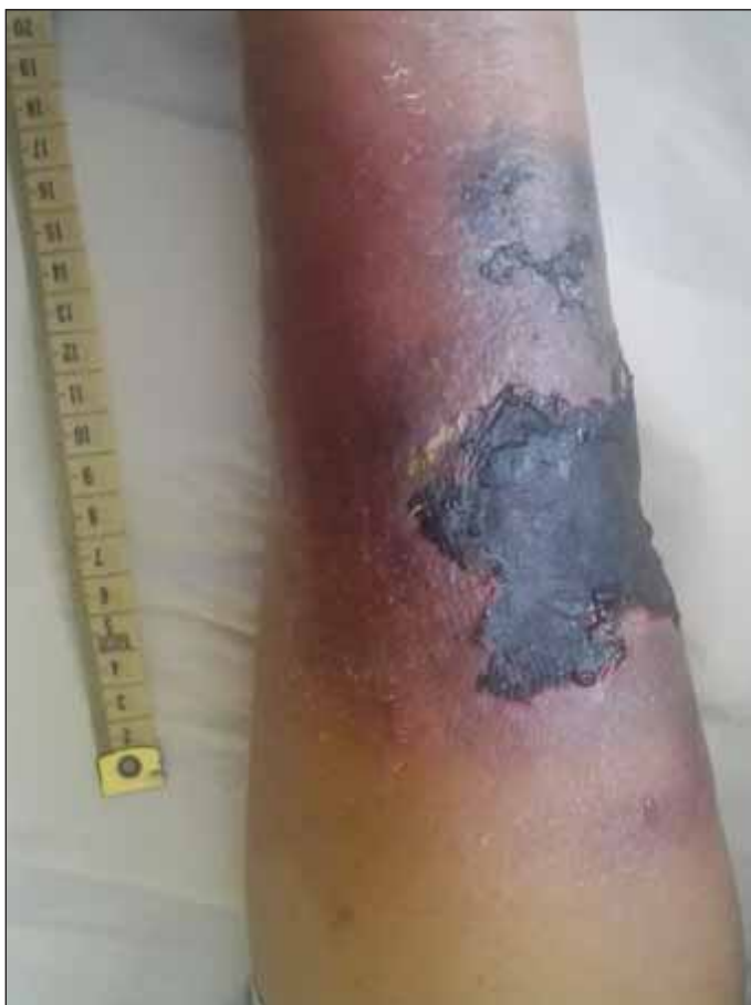
Obr. 3. Kožní forma mukormykózy – volární strana předloktí levé horní končetiny.