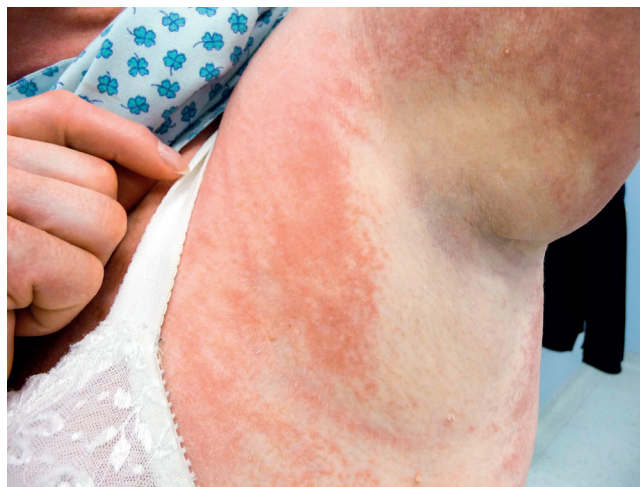
Obr. 2 Mramorovaná kůže pacientky se skleromyxedémem: místy bledá, místy lividní