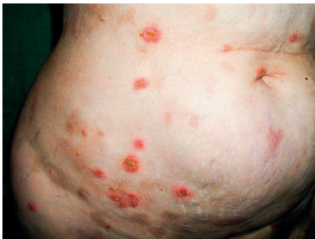
Obr. 7 Kožní puchýřnaté onemocnění IgA pemfigus u pacientky s mnohočetným myelomem

(kombinace bortezomib, cyklofosfamid, dexametazon) dovedla pacientku do kompletní remise mnohočetného myelomu, došlo k vymizení Mlg. Paralelně s vymizením Mlg vymizely i kožní morfy pemfigu. Kompletní remise trvala 3 roky a po tuto dobu byla pacientka bez kožních morf. Recidiva nemoci byla spojená s obnovením kožních morf, čím vyšší koncentrace Mlg typu IgA, tím více kožních morf. Léčba recidivy byla neúspěšná a pacientka nemoci nakonec podlehla. Tento případ demonstruje možnost, že Mlg může být také etiologickou příčinou pemfigu. Kožní změny dokumentují obrázky 7 a 8.