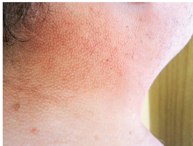
Obr. 6 Kůže v oblasti krku u pacienta se skleredémem

stolice maximálně 1× týdně. Byla provedena biopsie a histologické hodnocení kůže a podkoží. Jak histologický nález zmnoženého mucinu v celé retikulární dermis , tak klinický nález odpovídaly diagnóze skleredém ( skleroedema adultorum Buschke ). Vzhledem k současnému průkazu nálezů Mlg typu IgG kappa byl pacient dále směřován na hematologii. Histopatologické vyšetření válečku kostní dřene prokázalo 5 % klonálních plazmocytů. Zobrazovací vyšetření neprokázalo žádné postižení skeletu, diagnostická kritéria pro mnohočetný myelom nebyla naplněna.