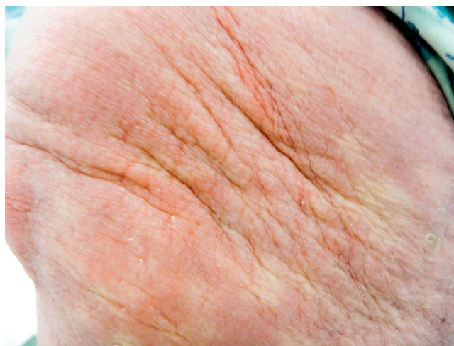
Obr. 3 Struktura ztlustělé kůže pacientky se skleromyxedémem

Histopatologické vyšetření válečku kostní dřeně prokázalo 2–4 % klonálních plazmocytů. Monoklonální imunoglobulin IgG kappa vstupně dosahoval koncentrace 9,0 g/l. Literatura popisuje souvislost skleromyxedému s Mlg, proto byla indikována léčba vedoucí k potlačení tvorby Mlg, i když diagnóza odpovídala monoklonální gamapatii nejasného významu (MGUS). Byla zvolena terapie pomocí kombinace cyklofosfamidů, bortezomibu a dexametazonu. Ta dosáhla poklesu Mlg z 9,0 g/l na 3,9 g/l. V průběhu léčby se dočasně zmenšily i kožní projevy. Pacientka uvedla, že pociťovala částečné změknutí kůže a podkoží, ale změny na kůži odpovídající skleromyxedému byly stále patrné. V roce 2010 proběhlo poslední kontrolní histopatologické vyšetření kůže. Patolog popsal rozšíření dermis