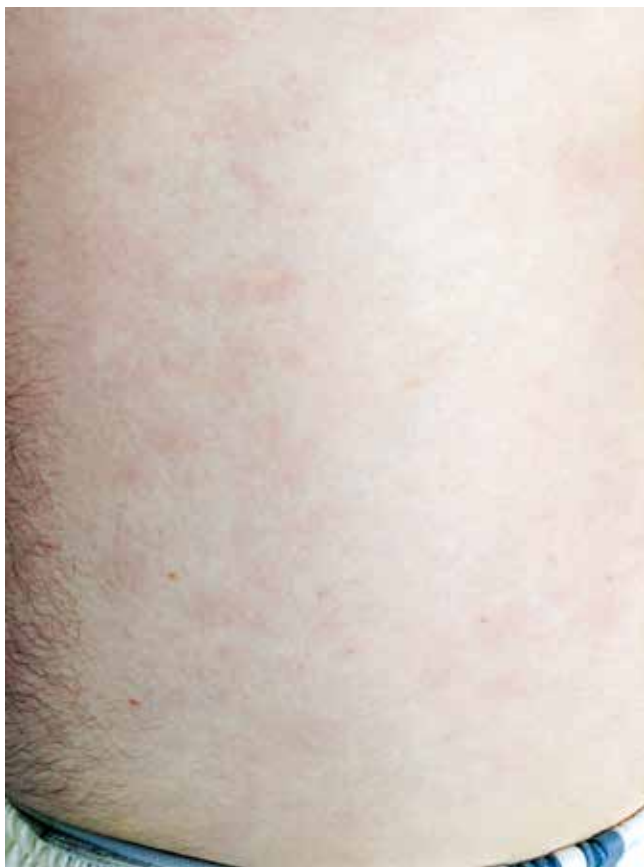
Obr. 2. Kožní léze na trupu, stav po zahájení předfáze kortikosteroidy

HLA-typizační vyšetření sestry nemocného neprokázalo shodu s pacientem, proto bylo zahájeno vyhledávání v registrech dárců kostní dřeně. Po dokončení standardních předtransplantačních vyšetření byl nemocný v červenci 2015 přijat k provedení alogenní TKB od nepříbuzenského dárce, 23letého muže, HLA inkompatibilního (1 neshoda na lokusu A), AB0 inkompatibilního (příjemce B+, dárce 0+), CMV negativního. Po