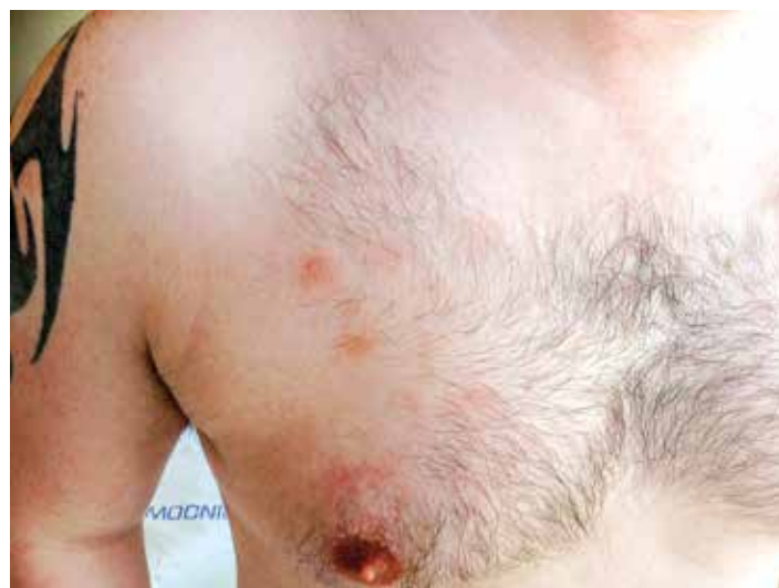
Obr. 3. Detail kožní léze na trupu, stav po zahájení předfáze kortikosteroidy (Zdroj: Hemato-onkologická klinika LF UP a FN Olomouc)

přípravném režimu s redukovanou intenzitou (RIC) Flu + Mel + TG (fludarabin 150 mg/m 2 , melfalan 140 mg/m 2 , thymoglobulin 4,0 mg/kg), byl 23. 7. 2015 proveden převod štěpu s obsahem 4,29 x 10 6 /kg CD34+ a 2,65 x 10 8 /kg jaderných buněk. Komplikací v potransplantačním období byl rozvoj klostridiové enteritidy (pozitivní klostridiový toxin i antigen) s promptním ústupem potíží na terapii metronidazolem per os. Další průběh hospitalizace byl již bez potíží. Nemocný byl propuštěn v den +25 po transplantaci ve stabilizovaném stavu do ambulantní péče. Prevence GVHD ( graft-versus-host disease ) byla zajištěna kombinací cyklosporinu A (CyA) a mykofenolát mofetilu (MMF). Aplikace CyA byla zahájena v den -1 před transplantací v dávce 6 mg/kg denně a následně korigována, s cílem udržet v časném potransplantačním období hladinu 200–300 ng/ml. Při absenci jakýchkoliv známek GVHD byla redukce CyA zahájena v den +56 s cílem pozvolného vysazení do dne +110 až 130 po TKB při remisi základního onemocnění a 100% dárcovském buněčném chimérismu. Podávání MMF bylo zahájeno v den +1 v dávce 30 mg/kg/den, s redukcí a postupným vysazením mezi dny +29 a +56.