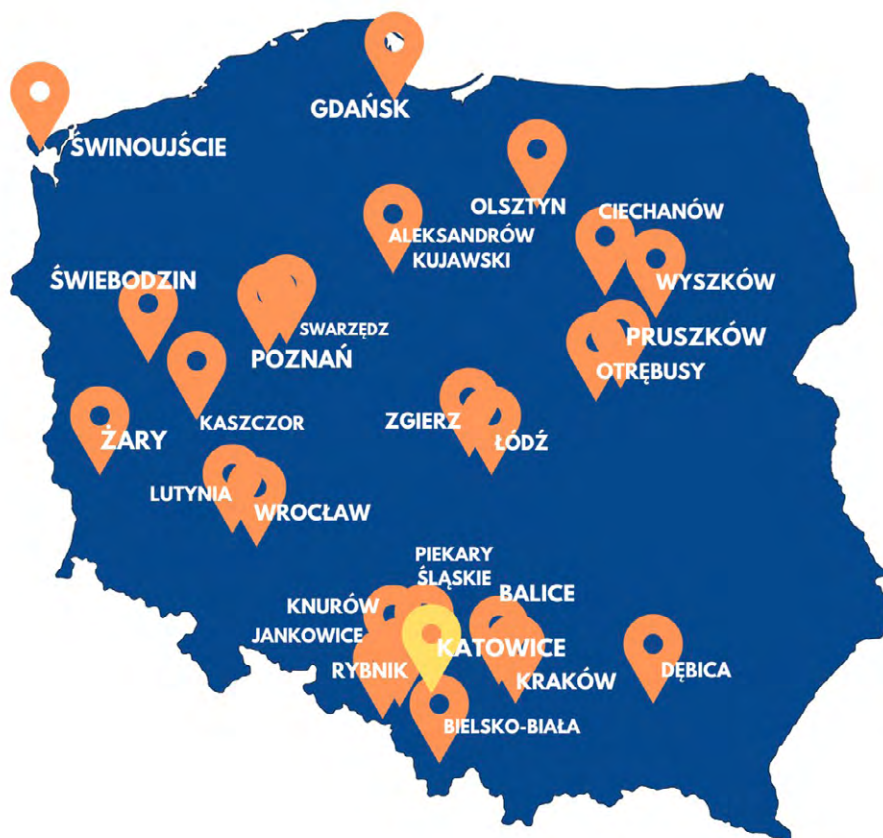
Mapa 1: Mapa implementácie programu InterACT v Poľsku ( https://fcl.org.pl/interact/ ) k 9. 3. 2024

vedené členmi krúžku sa pravidelne konajú online a sú k dispozícii všetkým záujemcom. Poľskí učelia, terapeuti a študenti majú prístup k propagačným materiálom ako aj k základným informáciám o tomto programe na webovej stránke Fundacja Centrum Logopedyczne ( https://fcl.org.pl/interact/ ).