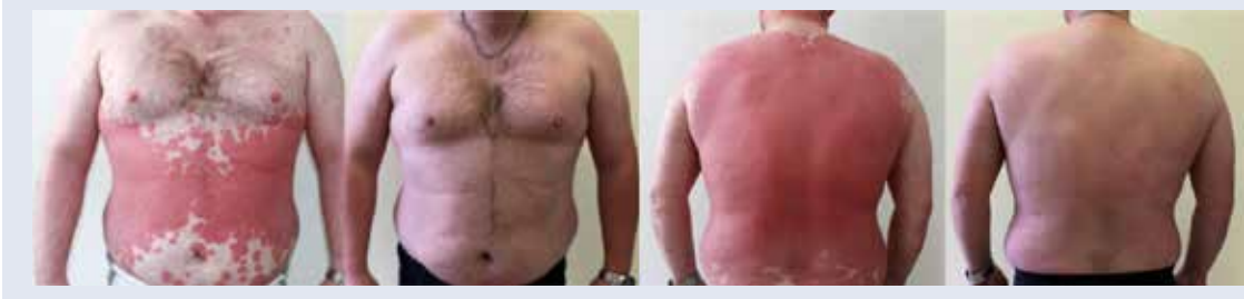
Obr. 2 | Pacient s metabolickým syndrómom s ťažkou formou psoriázy pred liečbou a po 3 mesiacoch liečby preparátom skupiny anti-TNF \alpha – adalimumabom