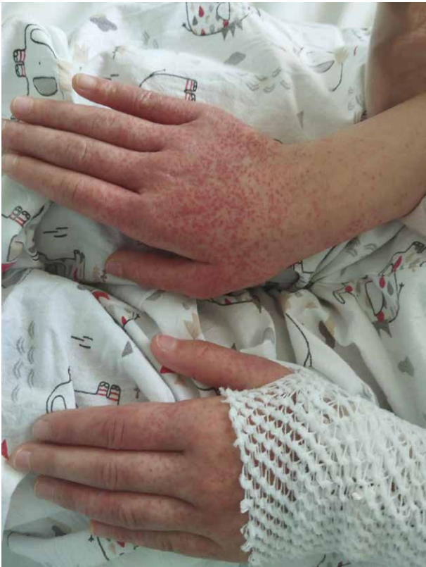
Obr. 1. Makulopapulózní exantém na rukou, pacient č. 6 Figure 1. Maculopapular rash on hands, patient no. 6