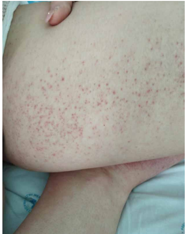
Obr. 2. Petechie na mediální straně levého stehna, pacient č. 16 Figure 2. Petechiae on medial side of left thigh, patient no. 16