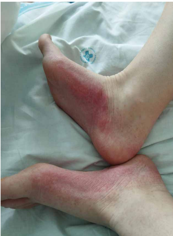
Obr. 3. Exantém na ploskách, pacient č. 16 Figure 3. Rash on the sole, patient no. 16