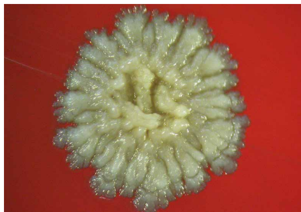
Obr. 1. Corynebacterium durum kolonie na krevním agaru Columbia, makrofotografie, skutečná velikost kolonie 1 mm

haceném 5 % CO 2 drobné (0,5–1 mm) kompaktní zvráskované kolonie, které silně adherují k podkladu (obr. 1). Na chudých agarových půdách (Mueller Hintonův agar) je při epimikroskopii možné pozorovat dobře vyvinuté mycelium, uzavřené kolonie s kompaktním středem a větvením na periferii [22] (obr. 2).