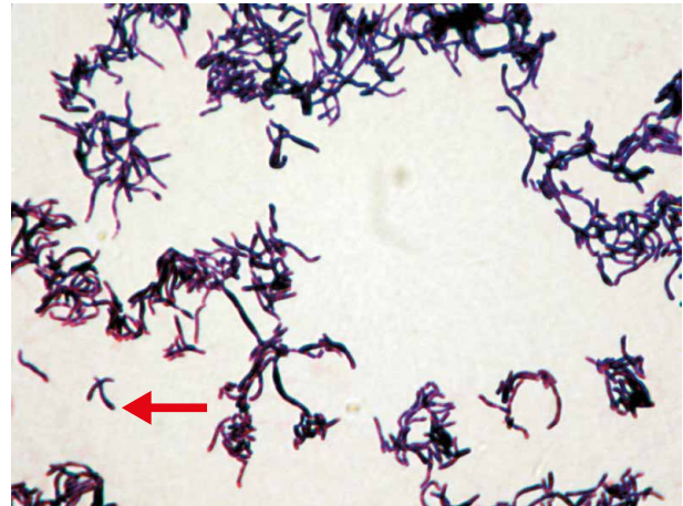
Obr. 3. C. durum nátěr z kultury obarvený dle Grama, typicky kyjovitě rozšířená tyčinka (šipka vlevo dole)

Pro kultivaci a současně předběžnou identifikaci C. durum je možné použít i selektivní kulturační médium označené OCM (oral Corynebacterium species medium), na kterém orální korynebakteria dobře rostou