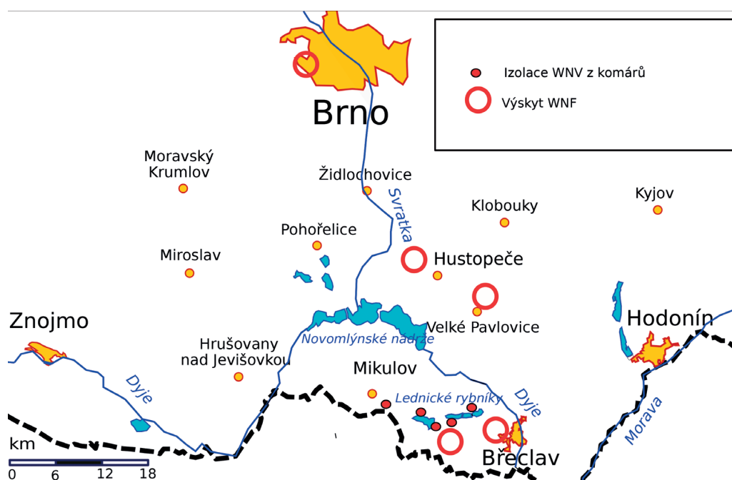
Obr. 1. Lokality akvirace nákazy Figure 1. WNV affected areas

Soubor kazuistik tvoří 5 autochtonních případů, splňujících kritéria potvrzeného případu západonilské horečky