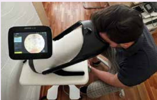
Obr. 1 | Vyšetrenie funduskamerou.

Pravidelné vyšetovanie je nevyhnutné pre včasný skrining DR a VPDM. Na Slovensku len približne 45 % diabetikov podstupuje pravidelné očné skriningové vyšetrenia [4]. Moderné technológie – nemydriatické kamery a softvér umelnej inteligencie – umožňujú rozpoznať lézie, urobiť skriningové vyšetrenie diabetickej retinopatie, znížiť diagnostickú záťaž pre očných špecialistov, časové náklady pre pacientov a zachytiť prípady s novozistenými mikrovaskulárnymi komplikáciami diabetu včas.