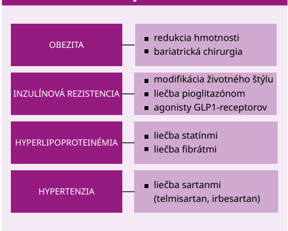
Schéma 2 | Vybrané modifikovateľné rizikové faktory pre NAFLD v kontexte metabolického syndrómu a ich manažment

Liečba NAFLD spočíva z liečby ochorenia pečene a pridružených metabolických komorbidít, ako sú obezita, hyperlipidémia, hypertenzia, IR a DM2T . Vybrané modifikovateľné rizikové faktory NAFLD v kon-