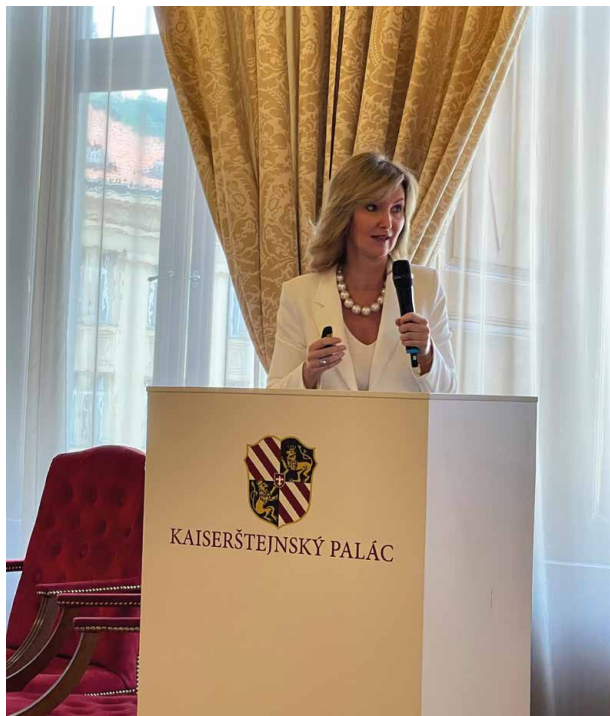
Choroby vlasů nesmíme přehlížet

nabízí celou řadu možností, jak i tyto choroby úspěšně zvládat. Vše bylo dokumentováno na úrovni evidence-based medicine i kazuistickými příklady. Její přednáška „Nechme na hlavě“ tak i zatím nepřesvědčeného posluchače ubezpečila o tom, že chybění vlasů zaručeně není jen vadou na kráse.