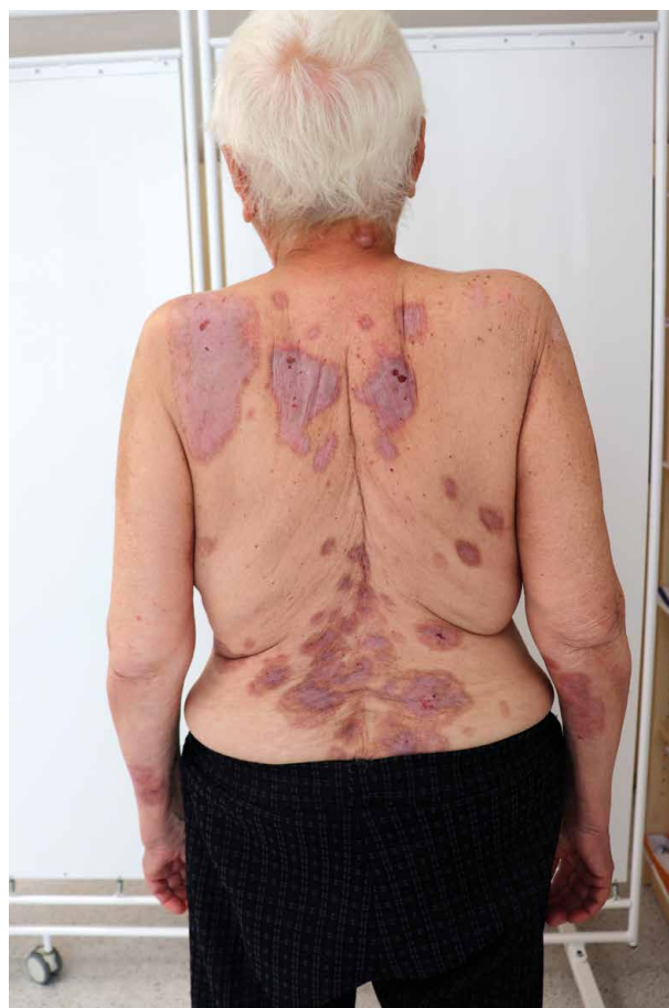
Obr. 2. Pacientka při kontrolním vyšetření 2 měsíce po propuštění z hospitalizace