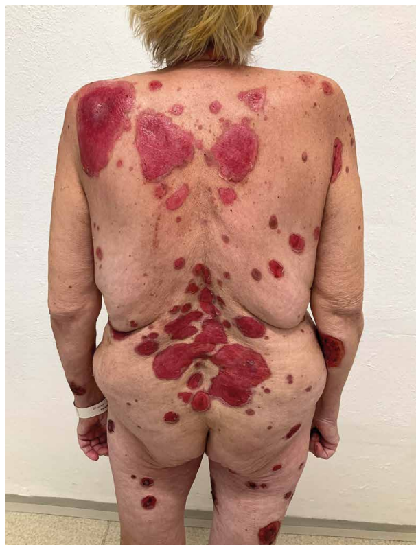
Obr. 1. Pacientka při vstupním vyšetření

Pacientka je nadále pravidelně sledována v ambulanci kožní kliniky, trvá remise bez známek aktivity onemocnění při monoterapii prednisonem v aktuální dávce 0,25 mg/kg/den (obr. 2).