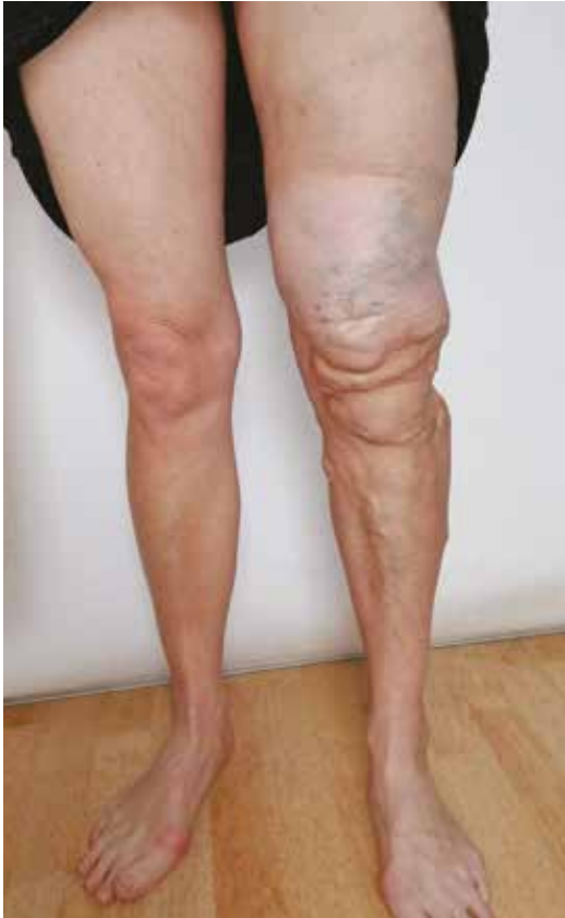
Obr. 10. Laterální marginální žíla na LDK

Rozdílné znaky kapilární malformace a povrchového hemangiomu jsou uvedeny v tabulce 2. V terénu naevus flammeus se vzácně mohou vyskytovat i hemangiomy, lymfangiomy, nebo angiokeratomy [1].