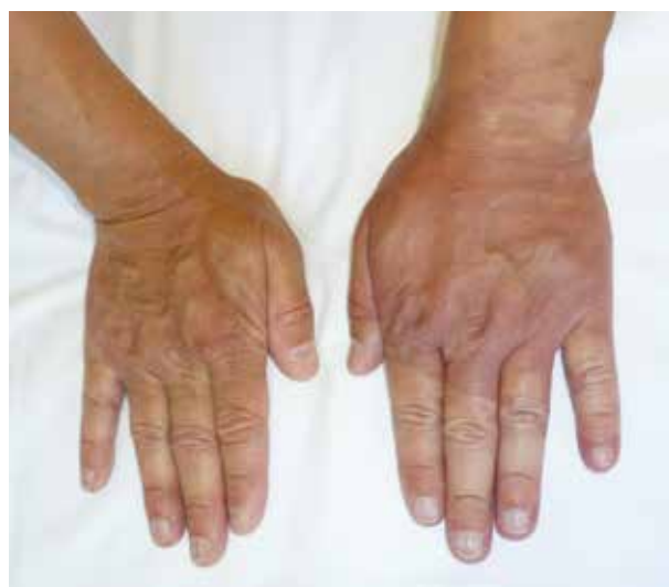
Obr. 5. Postižení levé ruky

Čtyřměsíční jinak zdravá holčička, narozená v termínu z fyziologické gravidity byla doporučena k vyšetření