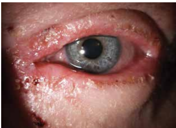
Obr. 2. Těžká atopická blefaritida a ekzém víček

Lékař by měl při nálezů ekzému očních víček u atopika zpozornět, zejména při kombinaci s pruritem a mnutím