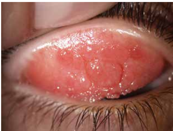
Obr. 4. Gigantopapilární reakce na horních tarzálních spojivkách při atopické keratokonjunktivitidě (konkrétně obr. 3)

Objektivně jsou víčka ztluštělá, zarudlá, intermitentně se objevují otoky. Později se objevuje deskvamace, lichenifikace, melanóza. Spojivky vykazují hyperemii, později i hypertrofii papil (obr. 4). Keratitida může progredovat až do vředu. Hojení je často provázeno jizvením a vaskularizací rohovky (obr. 5), což vede k trvalému poklesu zrakové ostrosti. Subjektivně postižení