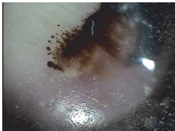
Obr. 5. Podnehtové krvácení

Podnehtové krvácení (obr. 5) má většinou bizarní tvar a postihuje pouze část nehtové ploténky (při odrůstání bývá naopak častěji orientováno napříč ploténky) [5]. Hemoragie je složená nejméně ze dvou barev, které se mohou výrazně lišit podle stáří projevu, alespoň jedna z nich má vždy odstín červené (červenofialová, červenohnědá, rezavě hnědá). V centru bývá krvácivý projev většinou homogenní struktury, jeho proximální okraj je ostrý nebo tvořený satelitními menšími globulemi, distální ohraničení bývá naopak nepřesné a v okolí projevu jsou častým nálezem „lineární třískovité“ krvácivé změny. Výjimečně jsou součástí dermatoskopického obrazu hemoragie také paralelní linie, které ovšem mají načervenalé zbarvení a neprobíhají nepřerušeně v celé délce ploténky. Někdy může být s ohledem na lokalizaci a intenzitu traumatu patrné také krvácení na nehtovém valu, což nesmíme zaměnit za Hutchinsonovo znamení. V případě podezření na podnehtové krvácení je ideální kontrola dermatoskopického nálezu s časovým odstupem při použití digitálního přístroje (obr. 6). Změny na nehtech ale odrůstají velmi pomalu (někdy dokonce jen rychlostí 1 mm za měsíc, především u palců na nohou), což je třeba zohlednit při volbě intervalu mezi jednotlivými kontrolami. Za ideální považujeme odstup nejméně 2–3 měsíců, kdy je v případě hemoragie již většinou vidět posun léze distálním smě-