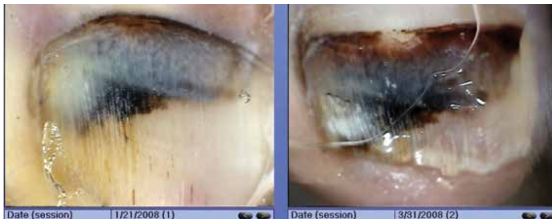
Obr. 6. Podnehtové krvácení, odrůstání léze distálně Follow-up v intervalu 2 měsíce digitálním dermatoskopem.