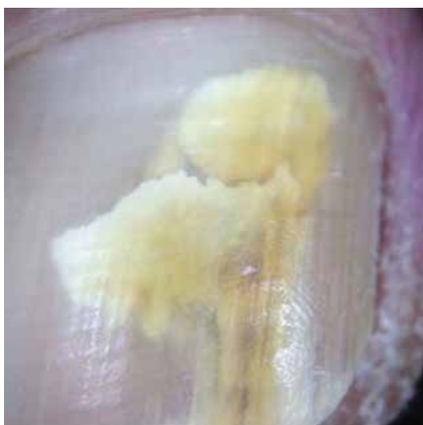
Obr. 7. Onychomykóza ( Trichophyton rubrum ) Dermatoskopicky projev birazního tvaru, nevytváří obraz longitudinální melanonychie. Barva žlutobílá.