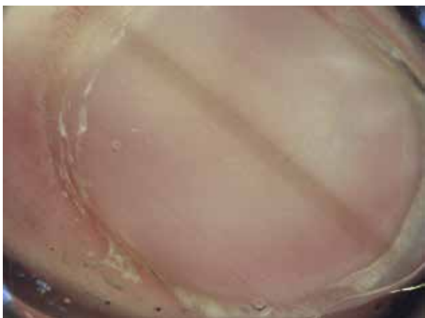
Obr. 1. Lentigo

Dermatoskopicky longitudinální melanonychie tvořená paralelně probíhajícími tenkými šedými proužky.