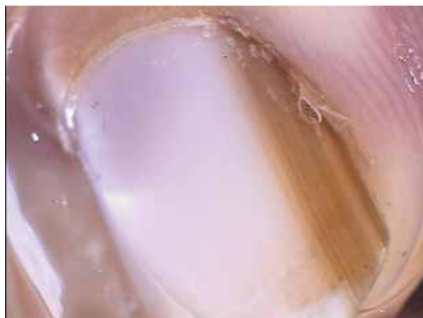
Obr. 2. Melanocytový névus

Dermatoskopicky longitudinální melanonychie tvořená paralelně probíhajícími tenkými šedými proužky.