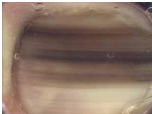
Obr. 3. Maligní melanom 0,3 mm

K dermatoskopickému vyšetření nehtu a zajištění dostatečné „průhlednosti“ nehtové ploténky je vhodné použít kontaktní přístroj s nepolarizovaným světlem a sonografický gel jako vhodnou imerzi. Více než v jiných lokalizacích je výhodné vyšetření digitálním dermatoskopem, který usnadní přístup k vyšetřované oblasti, umožní volbu optimálního zvětšení a především porovnání jednotlivých nálezů s časovým odstupem.