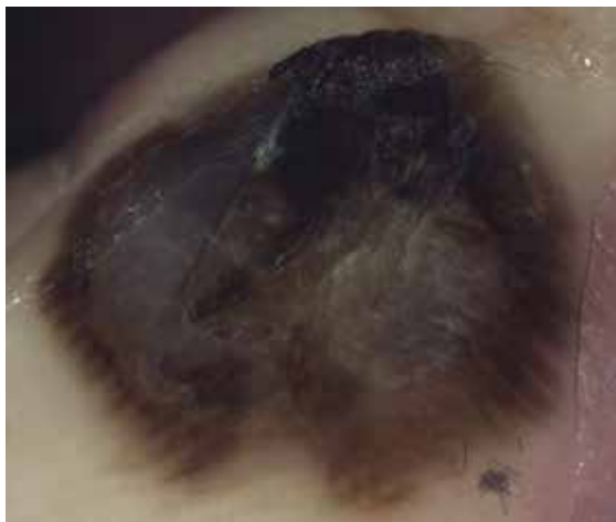
Obr. 7. Maligní melanom 1,1 mm s regresí Projev je větší než 1 cm v průměru, v centru bezstrukturální okrsky s difúzní šedomodrou nebo bělavou pigmentací, při okrajích široká lineární pigmentace nad cristae superficialis.

neum) pod mechanickým vlivem. Fibrilární pigmentace (především pravidelná) odpovídá ve většině případů melanocytovému névu, nevyklučuje ale v ojedinělých případech (nepravidelné uspořádání) tenký maligní melanom (většinou melanoma in situ).