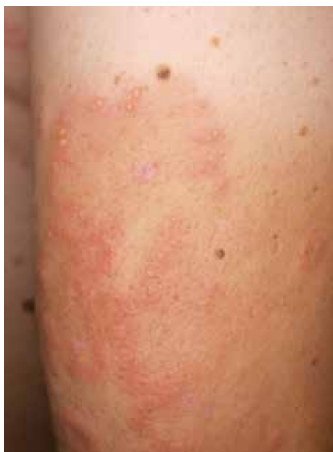
Obr. 3. Detail projevů s puchýřky v okrajích postižených ploch