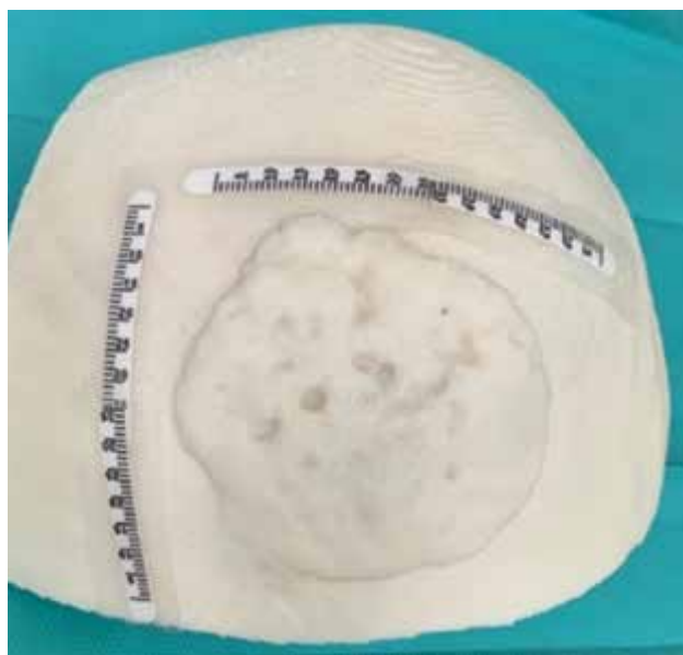
Obr. 3. 3D model oblasti