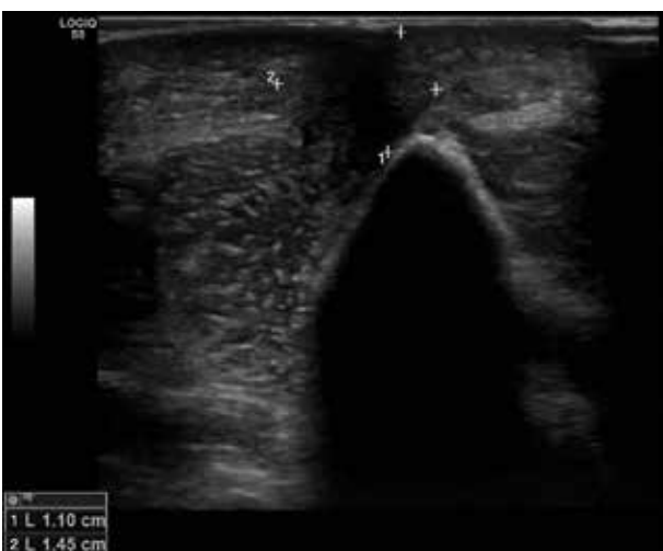
Obr. 5. Sonografický nález fibrózního uzlu v podkoží pravého loktu před léčbou antibiotiky

Klinicky se ACA projevuje 6 měsíců až 8 let po nákaze. Jen 30 % pacientů udává prodělané erythema migrans