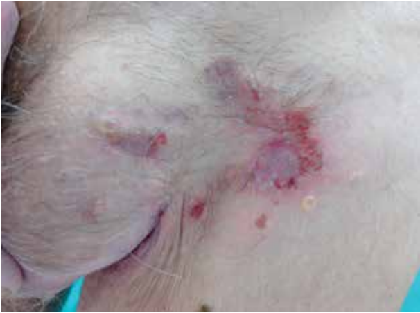
Obr. 1. Eroze s krustami a vezikulami na erytémové spodině