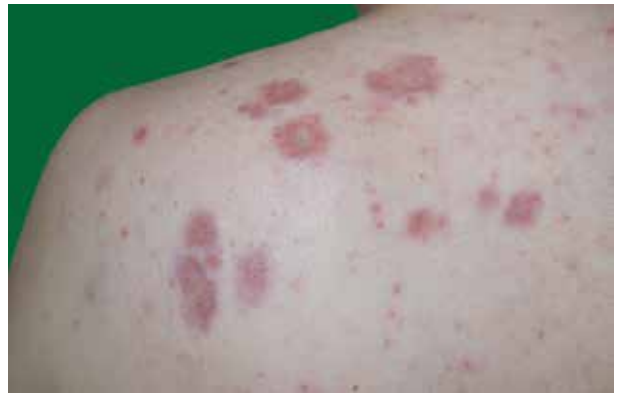
Obr. 2. Noduly v detailu

U pacienta byla proto zahájena kombinovaná systémová terapie prednisonem v dávce 20 mg denně a metotrexátem v dávce 10 mg 1krát týdně. Vzhledem k dobré terapeutické odezvě a pozvolné regresi plicního nálezu byla dávka prednisonu postupně snižována na současných 5 mg denně, dávka metotrexátu prozatím ponechána na 10 mg 1krát týdně. Pacient zůstává nadále v pravidelné pneumologické péči. Při poslední kontrole, 32 měsíců po zahájení léčby, byl pacient bez kožních projevů, plicní nález byl oboustranně s výraznou regresí postižení intersticia.