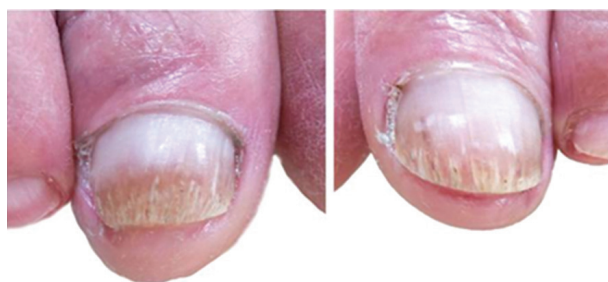
Obr. 3b. Nehtové ploténky palců obou dolních končetin po sedmi měsících od první aplikace NTP: bez hyperkeratóz na distálních stranách, odrůstají nehtové ploténky do půl až dvou třetin délky. Ostatní nehty bez mykotických změn.