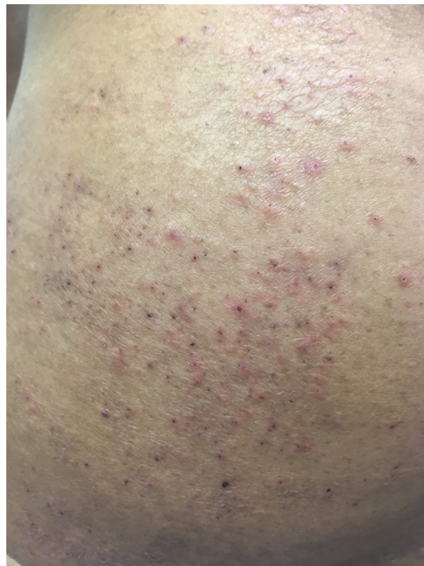
Obr. 1a, b. Výsev převážně na hýždích a dolních končetinách

Imunopatogeneze tohoto onemocnění je nadále tématem diskusí. Část autorů se domnívá, že v úvodu dochází k reakci typu Arthusovu fenoménu se vznikem imunokomplexů a jejich depozity ve stěně malých cév. Aktivací komplementu dochází ke zpuštění leukocytoklastické vaskulitidy vedoucí k destrukci cévní stěny a nekróze