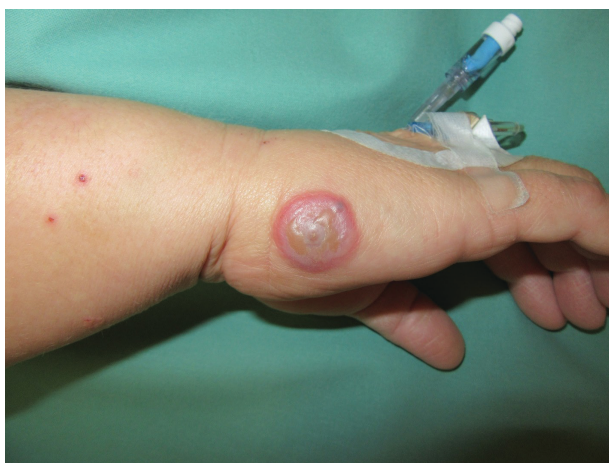
Obr. 1. Klinický obraz – dojičský hrbol na pravé ruce

tologického nálezu. Základní laboratorní vyšetření bylo v normě kromě mírné elevace CRP (13,4 mg/l, norma do 10 mg/l), GGT (3,54 \mu kat/l, norma od 0,17 do 1,25 \mu kat/l) a lehké leukocyturie. Tuberkulinový test byl negativní. Byl proveden stěr z léze s nálezem komenzálních bakterií a byla odebrána probatorní excize.