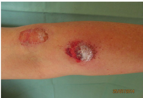
Obr. 1b) U levé loketní jamky kruhová eroze s fibrinovým povlakem, vedle hojící se eroze

nasazen hydroxyzin pro antipruriginózní a anxiolytický efekt. Pacientka byla po krátké hospitalizaci propuštěna, na plánovanou kontrolu nepřišla. V následujících letech se vždy s téměř ročními odstupy dostavovala s polymorfními stesky, kožní nález byl obdobný jako při hospitalizaci. V mezidobí byla vyšetřena na psychiatrii, nálezy s sebou nepřinesla. Podle jejího vyjádření ji tam „zničily prášky“. Při poslední dermatologické kontrole v roce 2014 byla pacientka v invalidním důchodu z psychiatrické indikace. Na předloktích se nacházely lineární exkoriace (obr. 1a), u levého lokte a na pravém nártu okrouhlé erodované plochy s fibrinovým povlakem (obr. 1b). Dále byly přítomny drobnější exkoriované plochy různého stáří na pravém stehně a bérkách. Léze byly zjevně způsobené arteficiálně. Od ošetřujícího psychiatra bylo zjištěno, že je pacientka léčena pro histrionskou poruchu a trvalou poruchu s bludy. Nedodržovala stanovenou léčbu – midazolam (hypnotikum), olanzapin, quetiapin (antipsychotika) a mirtazapin (antidepresivum). Pacientka špatně spolupracovala, nedocházela na kontroly, hospitalizaci na psychiatrickém oddělení opakovaně odmítla. Dva roky od prvního vyšetření spáchala sebevraždu skokem pod vlak.