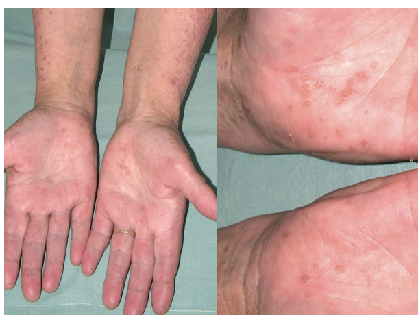
Obr. 8. Porokeratosis punctata palmaris et plantaris disseminata

V roce 1937 Andrew popsal novou klinickou variantu PK, provázenou mnohočetnými eflorescencemi lokalizovanými na trupu, genitálu, dlaních a na ploskách, kterou nazval DSP [5]. Tato forma PK je charakterizována drobnými červenými či hnědavými papulami s centrální atrofií objevujícími se obvykle kolem 5.–10. roku věku, ale i později, prakticky kdekoli na těle a může být provázena svěděním (obr. 8) [95]. Léze se mohou vyskytovat i na sliznici dutiny ústní [83]. DSP se častěji vyskytuje u transplatanovaných, HIV pozitivních, či jinak imunosuprimovaných pacientů [87].