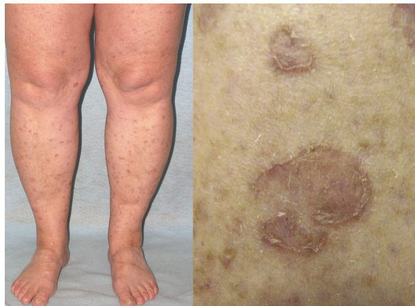
Obr. 7. Porokeratosis superficialis actinica disseminata