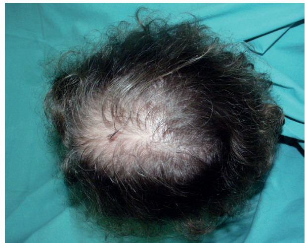
Obr. 4. FPHL – stupeň II podle Ludwiga

FPHL může být asociován s kožními známkami nadbytku androgenů, včetně hirsutismu a akné, i se systémovými známkami virilizace, jako jsou nepravidelnosti menstruace a infertilita [6]. U těchto žen je často pozorován mužský typ plešatění (hluboká, bitemporální recese) a řídnutí vlasů se může zlepšit po zahájení terapie antiandrogeny [5, 15], což poskytuje důkaz o androgen-dependentní povaze tohoto stavu. Ženy s typickou FPHL