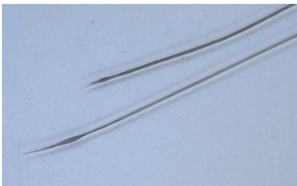
Obr. 3. Zašpičatělé proximální konce dystroficko-anagenních vlasů (zvětšení dermatoskopem 20krát)

bicinu, vinkristinu, méně negativní vliv na růst vlasů má např. bleomycin, daunorubicin, metotrexát, vinblastin. Podobně negativní efekt na růst vlasů má i radioterapie . Tíže výpadku je závislá jak na léčebné dávce a délce působení, tak na individuální vnímavosti organismu. Diagnostika obvykle nečiní potíže, vyvolávající faktor je evidentní.