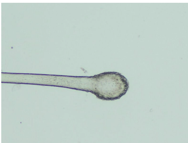
Obr. 2. Kyjovitý bulbus telogenního vlasu ve světelném mikroskopu (zvětšení 40krát)

větší procento vlasových folikulů dostane do telogenní fáze [27]. Pro vlasy, které vypadávají spontánně nebo při činnostech, jako je mytí a česání, je charakteristický malý keratinizovaný bulbus na proximálním konci vlasu (obr. 1). Lze je také snadno získat pomocí trakčního testu (obr. 2). Padání vlasů „i s kořínky“ pacientky často vnímají znepokojivě, ale paradoxně přítomnost zmíněného bulbu je spíše pozitivním zjištěním. Osoby s TE nebývají postiženy kompletní ztrátou vlasů (málokdy vypadne více než 50 % vlasů), i když v ojedinělých případech může být prořídnutí velmi výrazné. Nepřítomnost tohoto zduření by svědčilo pro anagenní respektive dystroficko-anagenní typ efluvia (viz níže). Výjimečně může TE postihnout i další oblasti, např. řasy nebo pubické ochlupení.