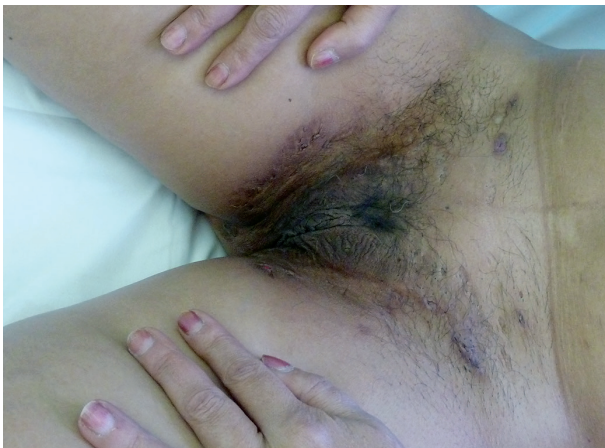
Obr. 6. Hidrosadenitis suppurativa v tříslích u téže pacientky

Tento autoinflamatorní syndrom patří mezi zcela nově popsané autoinflamatorní onemocnění, a to v roce 2012 Braun-Falcm, jr. Liší se od PAPA syndromu absencí epizod pyogenní artritidy. Pacienti mají acne conglobata a hidrosadenitis suppurativa , v těchto lokalitách může následně vzniknout pyoderma gangrenosum [3] – obr. 6, 7. Tyto syndromy se mohou různě sdružovat s dalšími nemocemi, takže se hovoří už o dalších nových akronymech: PAPASH (PASH a pyogenní arthritis), PsAPASH (psoriatická artritida a PASH) [Růžička T.: Autoinflama-