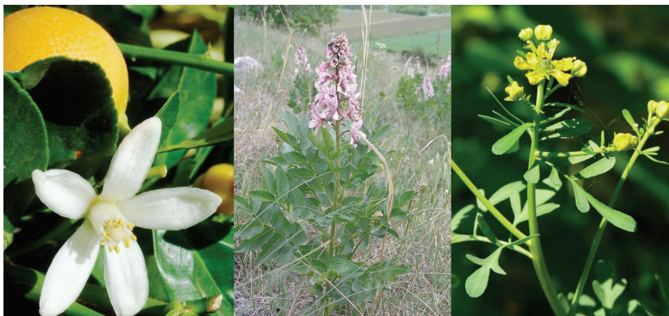
Obr. 3. Rutaceae (zleva: Citrus sinensis , Dictamnus albus , Ruta graveolens )

ní době. Ke zvýšení jejich obsahu může docházet vlivem stresu – napadení mikroorganismy, hmyzem, mechanickým poškozením, nevhodným klimatem a skladováním za nízkých teplot [7, 35, 49]. Jejich akční spektrum se nachází v rozmezí od 290 do 407 nm, s maximem nad 320 nm. Fotoreaktivita látek se mění podle substituce vodíkových atomů na molekule jednotlivých sloučenin methylovými, methoxylovými, hydroxylovými nebo dalšími radikály. Výraznější fototoxický efekt mají lineární psoraleny oproti angulárním. Nejsilnější fototoxický účinek pak má 5-methoxy-psoralen (5-MOP, bergapten) a 8-methoxypsoralen (8-MOP, xantotoxin) [29, 33, 35]. Polyacetyleny a deriváty thiofenu byly izolovány u čeledi Asteraceae (hvězdnicovité), ale fototoxické reakce nebyly publikačně zaznamenány, především asi proto, že tyto sloučeniny nebyly na kůži v dostatečně vysoké koncentraci či nepenetrovaly přes stratum corneum [8, 35]. Zástupci této čeledi jsou zejména zodpovědní za kontaktní alergické reakce prostřednictvím seskviterpenických laktonů [1, 33, 35].