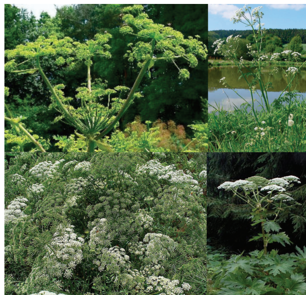
Obr. 5. Apiaceae (shora: Angelica archangelica , Anthriscus sylvestris Ammi majus , Heracleum mantegazzianum )

Nejdůležitější zástupci miříkovitých vyvolávají fototoxické reakce: