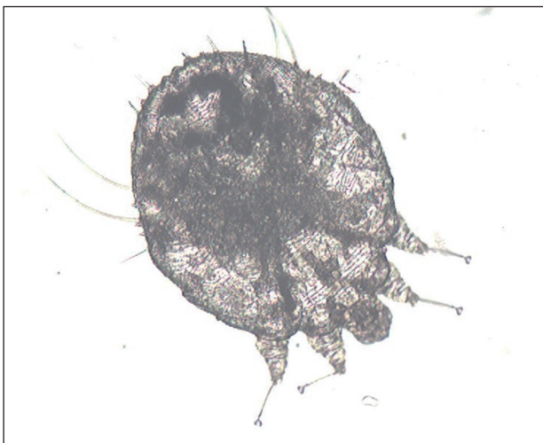
Obr. 5. Mikroskopický nález Sarcoptes scabiei (Danilla T.)

Mikroskopické vyšetrenie z líca aj z hlavy, z nánosov šupín z dlaní aj stupaj preukázalo prítomnosť dospelých samičiek a vývojových štádií Sarcoptes scabiei (obr. 4, 5). U matky bolo mikroskopické vyšetrenie tiež pozitívne.