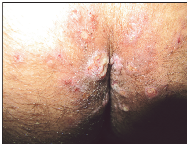
Obr. 3. Condylomata lata u HIV pozitivního pacienta

stádia mohou vykazovat nodulo-ulcerativní charakteristiky. Z klinických symptomů vedle klasických projevů (obr. 3 – Condylomata lata u HIV pozitivního pacienta) byla popsána palmoplantární keratodermie jako projev sekundární syfilis [66]. Častěji bývají popisovány i oční a ušní manifestace syfilis u HIV pozitivních pacientů [68]. Postižení CNS se může objevit podstatně dříve , a to dokonce u primární syfilis [6]. Doporučovaná terapeutická schémata nemusí být dostatečná v terapii a v prevenci CNS postižení: Poukazuje se i na možnost časných relapsů CNS postižení i po standardní terapii, pravděpodobně díky kombinaci alterované buněčné imunitní odpovědi při HIV infekci a nedostatečným hladinám účinného léčiva v CNS [6]. Jarisch-Herxheimerova reakce při terapii syfilis bývá častější. Před započítím terapie neurosyfilitické infekce musí být řádně vyšetřen mozkomíšni mok u všech HIV pozitivních osob s latentní syfilis delší než 1 rok nebo neznámé délky trvání.