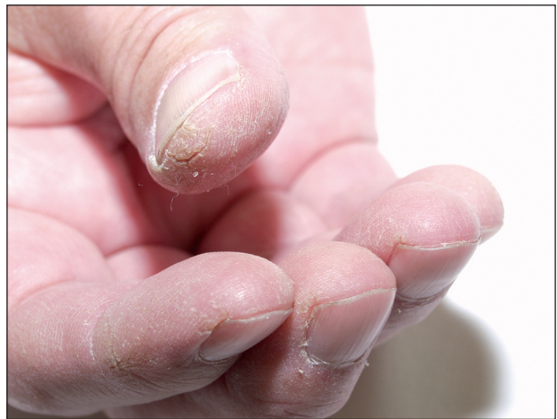
Obr. 8. Fisury na prstech.

Začínají většinou na palcích, ale mohou postihnout i jiné prsty (obr. 9), častá je opět sekundární infekce.