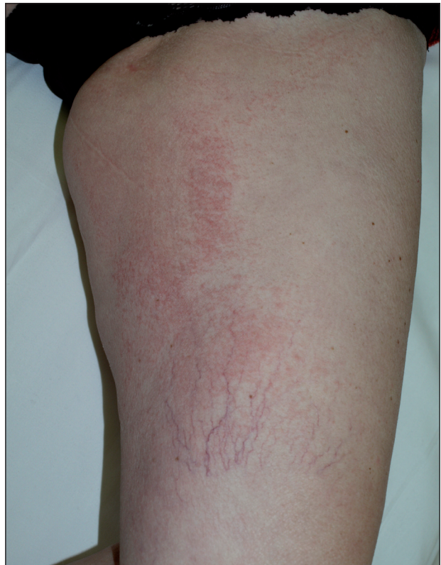
Obr. 7. Ekzémové změny při terapii EGFR inhibitory.

U 10 až 15 % pacientů vznikají po 2 až 4 měsících terapie paronychia s bolestivými pyogenními granulomy.