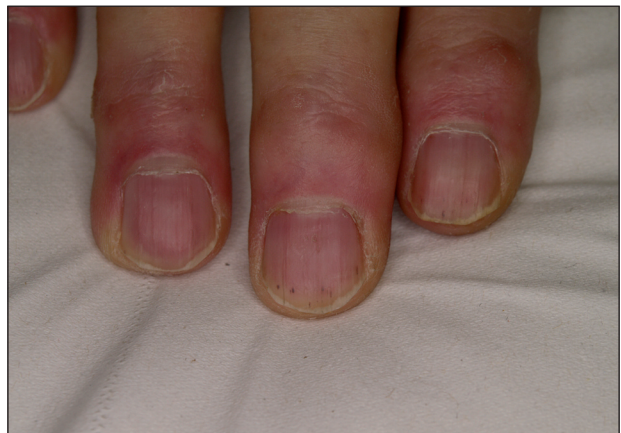
Obr. 12. Třískovité podnehtové hemoragie při léčbě sorafenibem.

pozorují u 40–70 % nemocných (obr. 12), častá je suchost kůže a sliznic, po případě alopecie či dysestézie kůže hlavy (9).