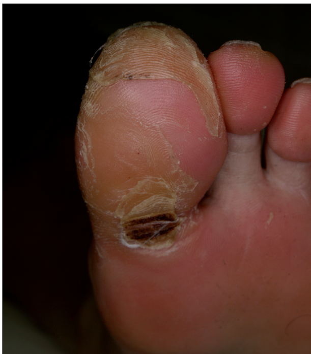
Obr. 11. Syndrom ruka-noha při léčbě sorafenibem.

Sorafenib (až v 48 %) a sunitinib (v 36 %) mohou způsobit za 3 až 4 týdny kožní reakce na rukou a nohou označované jako syndrom ruka-noha (anglicky hand-foot skin reaction ), které se liší od akralních erytémů pozorovaných při klasické chemoterapii (taxany, cytosin arabinosid, 5-fluorouracil aj). V místech tlaku (paty, hlavičky metatarzů) vznikají ostře ohraničené, erytémové, prosáklé otlaky, které jsou silně bolestivé a zhoršují se v horku (obr. 11).