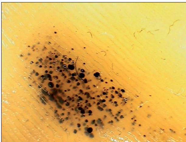
Obr. 5. Černé paty, dermatoskopický obraz.

Jde o častý nález především u mladších sportovců. Vzhledem k relativně tenké vrstvě podkožního tuku jsou kapiláry v dermálních papilách při hranici s epidermis vystaveny při intenzivním sportu značnému tlaku a střížným silám. To vede k jejich poranění a následně ke vzniku horizontálně uspořádaných, bodových, intraepidermálních a intrakorneálních hemoragií (3, 6, 10, 28, 29). Tyto léze jsou asymptomatické. Vyskytují se nejčastěji při horní hraně paty nad hranicí silnější plantární kůže, kde jsou podkožní kapiláry chráněny menší vrstvou tkáně (15, 18, 23, 28, 31). Postižení bývají například tenisté, fotbalisté nebo basketbalisté. Jediným úskalím tohoto benigního nálezu je možná záměna s maligním melanomem (3, 6, 10, 15, 18, 23, 28, 29, 31). V diferenciální diagnostice pomáhá anamnéza sportovních aktivit a často oboustranný nález. Dermatoskopický obraz je většinou jednoznačný (obr. 5). Diagnóza může být také potvrzena jemným odstraněním několika petechií skalpe-