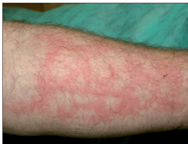
Obr. 13. Chladová kopřivka.

Solární kopřivka se objevuje několik minut po vystavení kůže slunci nebo umělým světelným zdrojům. Ustupuje většinou do hodiny po ukončení expozice (4, 24, 28, 30). Počátečním příznakem je svědění, následované erytémem a urtikariálním výsevem. Častěji než na opakovaně exponovaných oblastech (obličeje, ruce) dochází k výsevu na místech méně často vystavených záření (trup). V léčbě první linie jsou doporučována antihistaminika, jako druhá linie pak desenzitizační fototerapie, případně PUVA (5). Pokud akční spektrum leží v UV oblasti, je prevencí účinná fotoprotekce, a to externí nebo