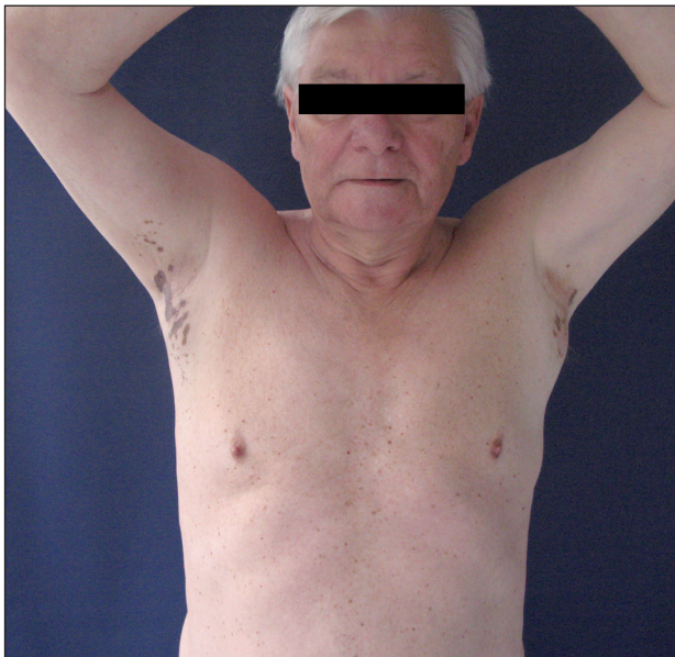
Obr. 1. Hnědočerné makuly v axilách.

Byla provedena probatorní excize. V mikroskopickém nálezu byla popsána lichenoidní reakce, atrofie epidermis, výraznější inkontinence pigmentu. Závěr: lichen planus pigmentosus inversus (obr. 3)