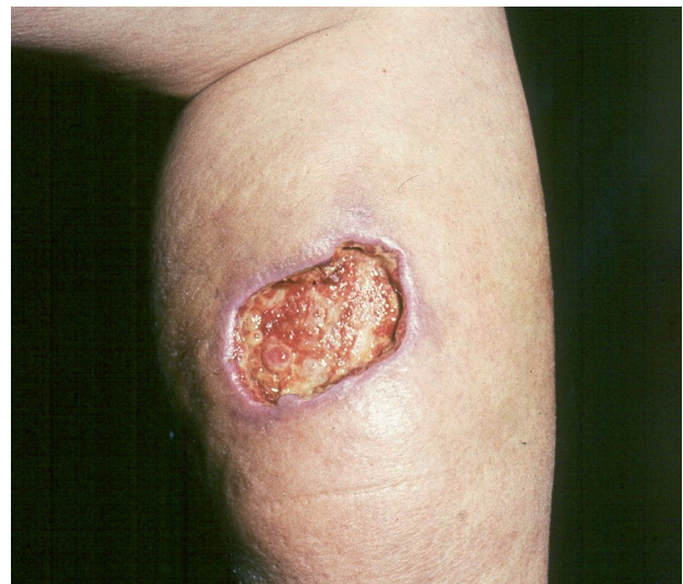
Obr. 3. Ulcus cruris arteficiále.

Arteficiální ulcerace se vyskytují na kterémkoliv místě těla, dolní končetiny nevyjímaje. Poškozující příčinou jsou látky chemické, které kůži poleptají, nebo účinky fyzikální, nejčastěji vysoké teploty (např. popálení cigaretou). Nápadným znakem takto navozených bérceových vředů je zdravé a nepostižené okolí (obr. 3).