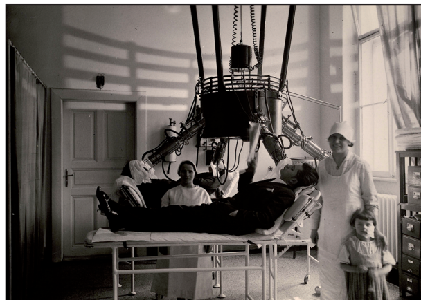
Obr. 4. Světloléčba.

Intenzivní vědecká práce a výměna nabytých poznatků