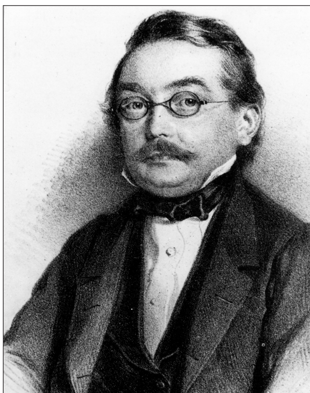
Obr. 1. Ferdinand Hebra.

Již před Hebrou věnovali pozornost kožním chorobám význačné osobnosti medicíny jako Angličané Willian a Bateman, Francouzi Alibert, Biette, Cazenave a Rayer a Němci Plenck, Fuchs a Isensee, takže Hebra měl k dispozici o dermatózách literaturu. Ale teprve Hebrovi se podařilo vytvořit přehlednou systematiku, vyzdvihnout důležitost tohoto úseku medicíny a vymanit jej z jiných