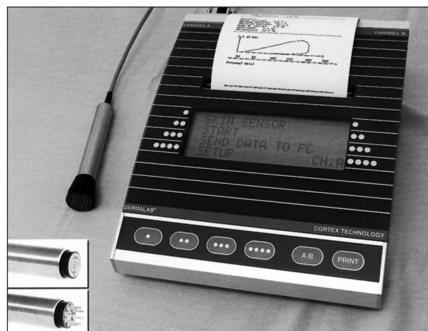
Obr. 2. DermaLab se třemi sondami.

Jde o dostupný přístroj, považovaný rovněž za standardní, jehož cena se pohybuje kolem 100 000 Kč (obr. 2). Pomocí různých sond kombinuje všechny způsoby přístupu k měření. Jehlová sonda používá princip impedančního měření (odporu) a pomocí ploché sondy, 13 mm v průmě-