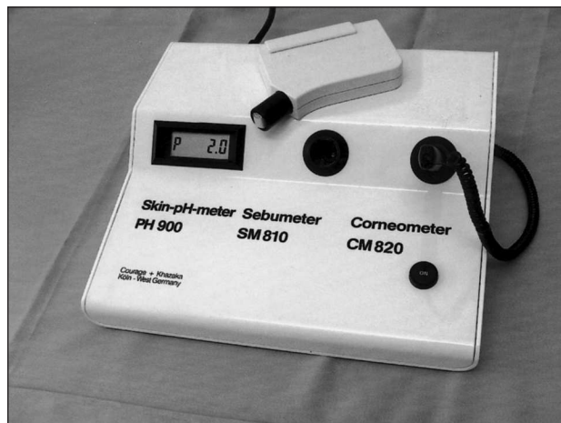
Obr. 1. Corneometr se sondou, resp. kombinovaný přístroj se Sebumetrem a pH metrem.

Dvě kovové desky oddělené tenkou vrstvou izolátoru (dielektrikum – vzduch, vakuum, sklo, plast, elektrolyt) se označují jako kondenzátor , neboť umožňují hromadit