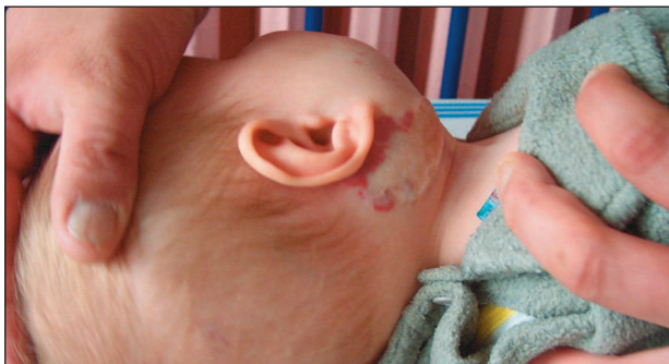
Obr. 2. Obsáhlý smíšený hemangiom obličeje a krku.

Při léčbě interferonem \alpha se mohou projevit akutní nežádoucí účinky, jako letargie, snížený krevní tlak, srdeční arytmie, parestézie, zvracení, nauzea, nechutenství, myalgie, dále závažnější subakutní a chronické nežádoucí účinky: chřipkový syndrom, hepatotoxicita, hubnutí, průjem, neurotoxicita, závrať, pocení, deprese, mentální zpomalení, distální parestézie, kardiovaskulární příhody a jiné (1, 7, 10). Námí sledovaná pacientka snáší terapii interferonem \alpha bez větších nežádoucích účinků a dochází u ní k výrazné regresi hemangiomu. Podle výsledku terapie, se dále uvažuje o event. embolizaci (obr. 2, 3).