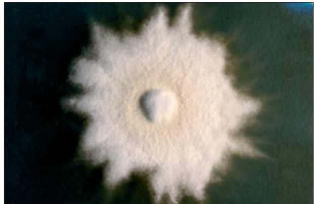
Obr. 3. Kolonie Trichophyton mentagrophytes .

vaci. Bakteriologická kultivace prokázala po 2 dnech koaguláza-negativní stafylokoky a Propionibacterium acnes , mykobakteria izolována nebyla, také vyšetření na aktinomykózu bylo negativní. Po 5 dnech se na Sabouraudově agaru s cykloheximidem při teplotě 27 °C objevily drobné plísňové kolonie, po 9 dnech byl jejich růst zřetelný. Makroskopicky byly bílé se žlutým nádechem, hrubě zrnité, jejich střed byl mírně vyzdvižený a okraje zrnité s paprscitě se rozbíhajícími jemnými vlákny (obr. 3). Pro bližší identifikaci byla použita mikrokultura – v mikroskopickém obrazu byly na septovaných vláčkách kulovité mikrokonidie a chlamydospory, nechyběla ani vlákna vzhledu úponků vinné révy, která jsou typická pro T. mentagrophytes . Z kultury byl dále zhotoven nativní preparát s Lugolovým roztokem, v němž byly prokázány makrokonidie kyjovitého tvaru s příčnými septy (obr. 4, 5). Identifikace byla doplněna biochemickým ureázovým testem, který prokázal T. mentagrophytes var. mentagrophytes .