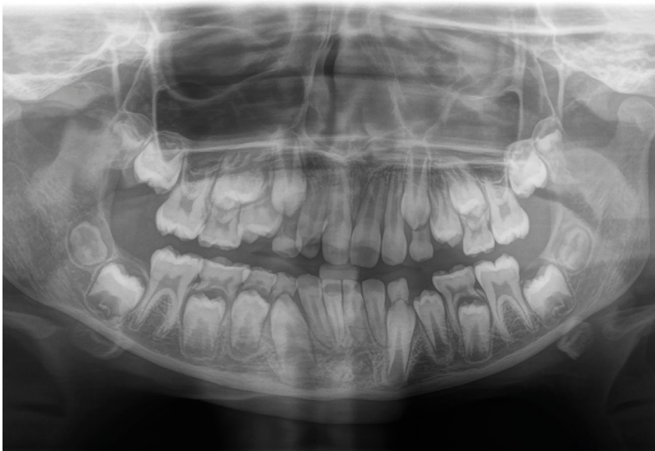
Obr. 1 Druhé moláry ve stadiu vývoje E podle Demirjiana – začíná se tvořit bifurkace.