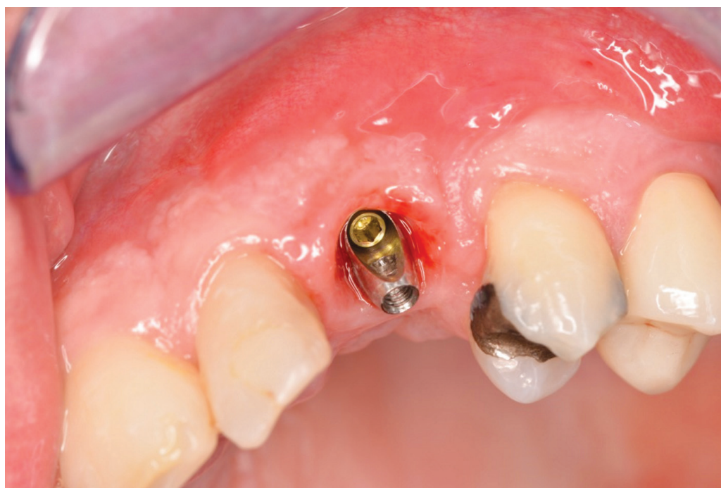
Obr. 3 Abutment pro tranzverzální šroubování in situ, okluzní pohled; nevýhodná osa manipulačního kanálu je převedena na orální stranu suprastrukury

Fig. 3 The abutment for transversally screw-retained crown, occlusal view; the screw access hole is on the oral surface of the crown