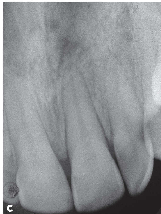
Obr. 1a, b, c Pohled na frontální úsek horního zubního oblouku ze strany vestibulární (a) a ze strany palatinální (b) (autoři se omlouvají za zhoršenou kvalitu fotografie), intraorální rentgenogram zubů 11–22 v Cieszyrského projekci (c)

Dobře spolupracující pacientka neudávala při vyšetření žádné celkové onemocnění či alergie, léky trvale neužívala. V dětství prodělala ortodontickou léčbu. Před dvěma roky přestala kouřit, do té doby kouřila několik let až dvacet cigaret denně. Vědomé parafunkce, bruxismus, úraz, jakoukoli operaci v orofaciální oblasti či dřívější aplikaci piersingu jednoznačně popírala. Zuby čistila podle doporučení ošetřujícího lékaře vícekrát denně měkkým zubním kartáčkem se zubní pastou modifikovanou Bassovou technikou, pravidelně používala též mezizubní kartáček.