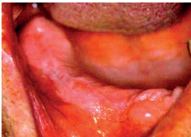
Obr. 3 Homogenná leukoplakia na pravom alveolárnom hrebieni v rozsahu od prvého premolára až po tretí molár. Ide o následok uvolnenej fixnej náhrady a jej mechanického dráždenia (Đurovič)

давковým výrastkom hyperkeratoticky zmeneného tkaniva. Túto lpl. klinicky často označujeme termínom lpl. verucosa. Tieto útvary však v tomto type nemajú nadobudnúť takú veľkosť, že by dochádzalo v brázdach k tvorbe väčších priestorov alebo vredov.