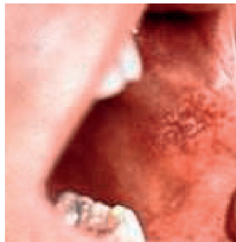
Obr. 5 Škvrnitá leukoplakia na ľavej bukálnej sliznici. Začína v ústnom kútiku, rozširuje sa distálne, nie je dobre ohraničená a v jej okolí je prítomný zápalový dvorec (Đurovič)

Ak je lpl. plát rozsiahlejší a plošný, má tendenciu hrubnúť. Následkom nakopenia hyperkeratoticky zmeneného tkaniva v ňom môžeme pozorovať trhliny a ragády rôznym smerom. V prípade, že sa tieto afekcie hromadia, dochádza medzi nimi k bra-