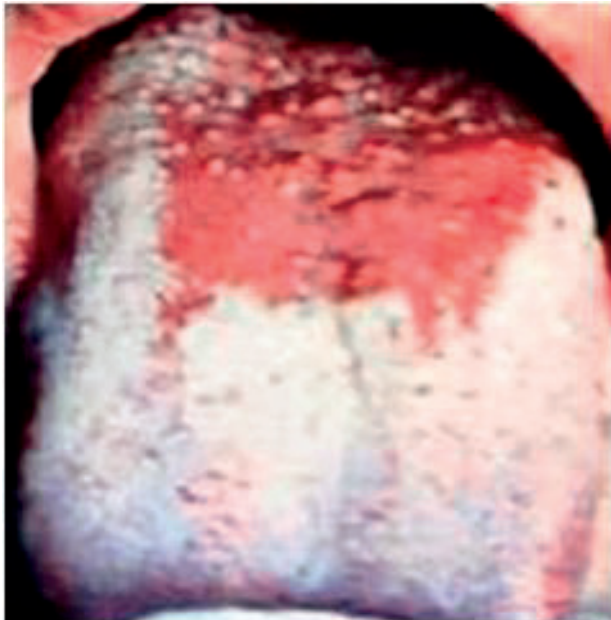
Obr. 6 Linqua plicata. Obmedzený počet rýh je lokalizovaný na tele jazyka. Rhyhy nie sú hlboké a stav nevyvoláva ťažkosti