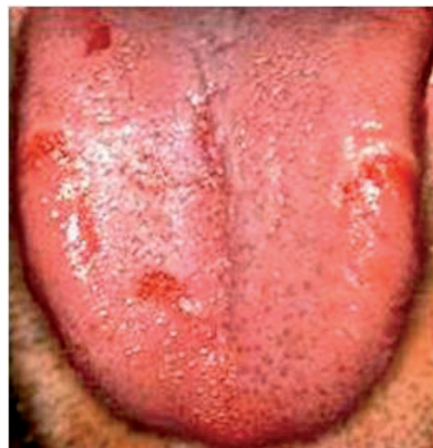
Obr. 5 Povlak je normálny, na povrchu jazyka sú čerstvé erozie. Stav je u recidívnej infekcii Helicobakter pylori (Ďurovič)

V posledných rokoch sme svedkami toho, že sa zvyšuje výskyt orálnych infekcií vyvolaných Candida albicans . Orálne kandidózy pozorujeme u pacientov v strednom veku s maximom výskytu u žien nad 40 rokov. Orálne kandidózy majú viac foriem, ale