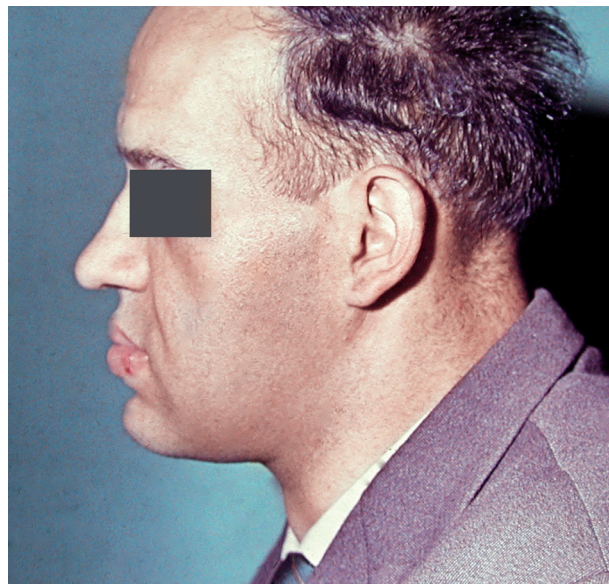
Obr. 3 a, b Obličej muže postiženého akromegalií z frontálního pohledu (a) a bočního pohledu (b), pacient též na obr. 1 a 6b