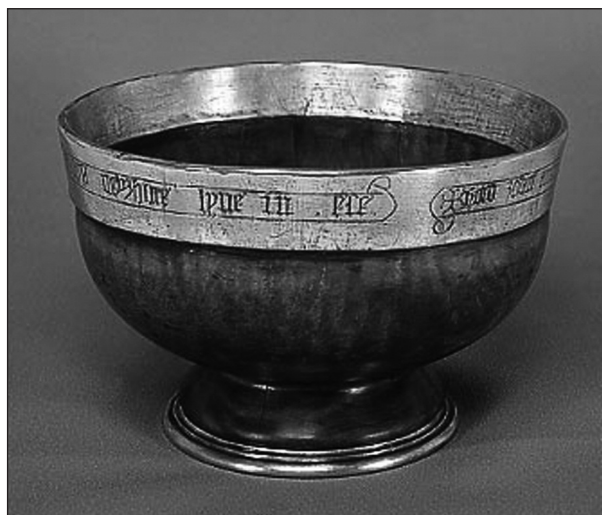
Obr. 1 Nádobu Mazer z javorového dreva s obrubami z pozláteného striebra, pochádzajúca z roku 1380 [12]