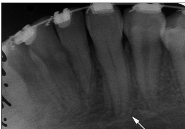
Obr. 4. Intraorální RTG snímek téže pacientky z období 10 měsíců po transplantaci. Je dokončen vývoj kořene transplantovaného špičáku (bílá šipka). Probíhá postupná obliterace dřevné dutiny a kořenového kanálku. Periodontální štěrбина je dobře patrná. Nejsou přítomné žádné známky patologického hojení.

větší než 1 mm, dojde k revaskularizaci nekrotické dřene [9]. V tomto případě není nutné nekrotickou dřeň odstraňovat a provádět endodontickou léčbu transplantátu. Dochází-li k revaskularizaci, objevuje se postupně pozitivní odpověď na zkoušky vitality. Za 2 měsíce po transplantaci u 2 % zubů, za 6 měsíců je pozitivní reakce u 90 % zubů a po 1 roce u 95 % transplantátů. Zároveň u všech transplantovaných zubů je projevem hojivých procesů dřene ukládání dentinu na stěny dřevné dutiny a kořenového kanálku. První známky obliterace dřevné dutiny je možné zaznamenat již 8 týdnů po transplantaci, pravidelně se vyskytuje 6 měsíců po výkonu (obr. 4) [3]. I přestože dojde k obliteraci, má 90 % zubů i nadále pozitivní reakci na zkoušky vitality.